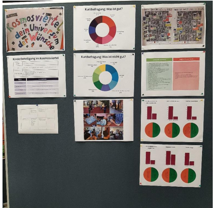
Abbildung 2: Ergebnisse Kinderbeteiligung