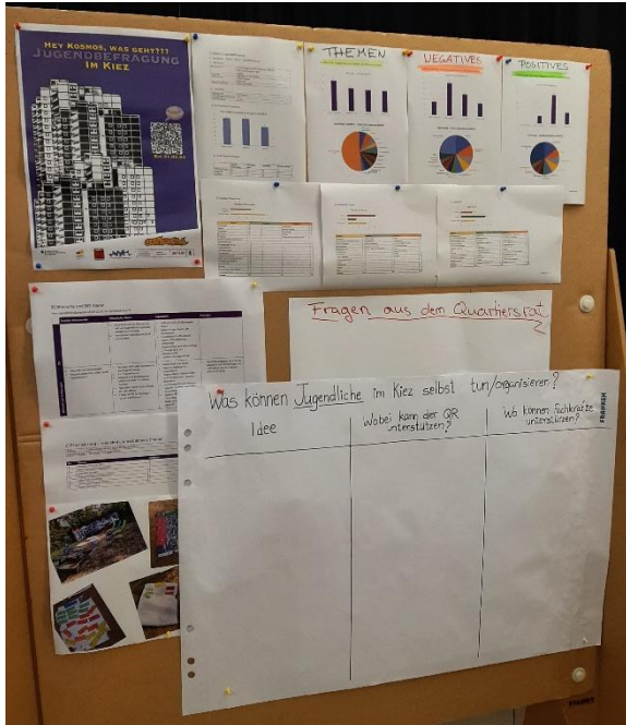
Abbildung 1: Ergebnisse Jugendbeteiligung

Der Quartiersrat hatte anschließend die Möglichkeit sich die Ergebnisse der Beteiligungsaktionen an Pinnwänden anzuschauen und Rückfragen zu stellen. Zusätzlich gab es eine Pinnwand, wo nochmals alle wichtigen Orte für Kinder und Jugendliche auf einer Karte markiert waren.