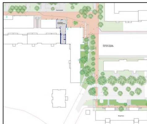
Bild: Neue Verbindung zwischen Stadtteilzentrum und Bürgerhaus

Am Stadtteilzentrum, in dem zukünftig ein Begegnungscafé angedacht ist, wird eine neue Terasse mit einer angrenzenden Treppenanlage entstehen. Die Terasse soll nicht nur Platz für kleinere Veranstaltungen bieten, sondern soll auch als Außenbereich des zukünftigen Begegnungscafés dienen. Besonders an die Eltern wurde hier gedacht, da von der Terasse aus der neue Spielplatz direkt im Blick ist. Die ersten Ergebnisse der Umgestaltung des Weges bis hin zum Kiezladen WaMa sind bereits abgeschlossen und im Zeitplan. Die Terasse soll im August fertiggestellt werden.