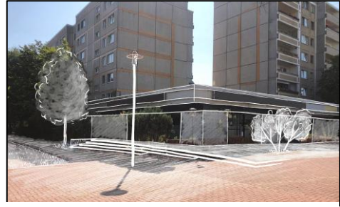
Bild: Terrasse am neuen Stadtteilzentrum

Vom neuen Stadtteilzentrum soll in Zukunft ein gerader und rot gepflasterter Weg direkt zum Bürgerhaus führen. Neben dem Weg wird mehr Grünfläche entstehen und ein Teil der aktuell gepflasterten Fläche dafür entsiegelt.