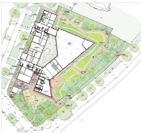
Bild: Planungen für den Bürgergarten

Auf der Jugendseite des Gartens, der durch den Anbau des Saals, ursprünglich verkleinert wurde, werden zum einen neue Flächen geschaffen. So wird es wieder ein Beachvolleyballfeld, aber zusätzlich auch einen kleinen Basketball-Court, eine kleine Tribüne, eine Überdachung, eine Graffiti-Wand, ein Depot für Außenspielgeräte und auch eine Feuerstelle und fest installierte Sonnenliege geben. Was genau gebaut wird, ist das Ergebnis einer Beteiligung der Jugendlichen als auch von Besucherinnen und Besuchern, als auch Mitarbeiterinnen und Mitarbeitern im Haus, die im Jahr 2024 mit den beauftragten Landschaftsarchitekten und dem Quartiersmanagement umgesetzt wurde.