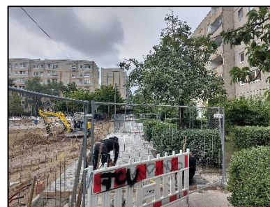
Fotos: aktueller zwischen Quartiersplatz, Spielplatz und Bürgerhaus