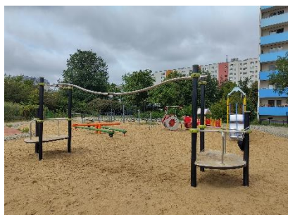
Bild: Seilbahn am Traktorspielplatz

Wie schon in der letzten Baustellenzeitschrift angekündigt, hat die bei Kindern sehr beliebte Seilbahn im Kosmosviertel einen neuen Platz gefunden.