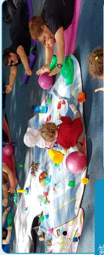
Mütterfitness, bwgt e.V.