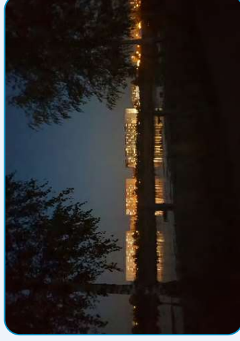
Monat Dezember Kalender 2021 (prämiertes Foto)